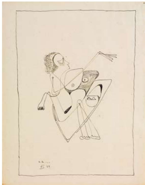
HERZINHALT 32 x 25 cm