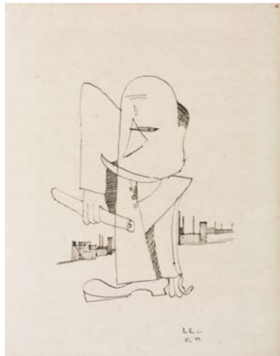
MONOPOL (Der Architekt) 32 x 25 cm