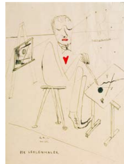
DER SEELENMALER (Kandinsky)